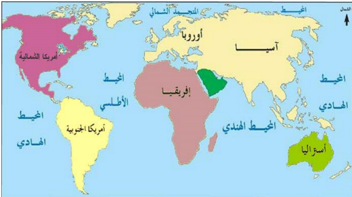
خريطة العالم توضح القارات والمحيطات