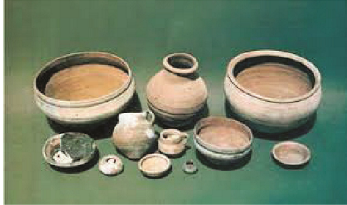
صور قطع أثرية من حضارات العصور

وقد كان أجدادنا الأوائل أهل حضارة ومدنية. وقد بدأت الحضارات المعروفة في السودان قبل حوالي أربعة آلاف سنة. وتلك الفترة نسميها العصور الحجرية، لأن الانسان كان يصنع أدواته في تلك الفترة من الحجر. وبعض الشعوب المتقدمة حضارياً- كما كان عندنا في السودان- صنعوا الأدوات التي يحتاجون إليها في حياتهم كالقؤوس والمدى والحراب والقدر وأدوات الزينة والملابس من مواد أخرى إلى جانب الحجر مثل الخشب والجلود والفضة والمعادن كالحديد والنحاس والبرونز. لذلك كانت لنا مدنيات وحضارات راقية في السودان في العصور الحجرية، نذكر منها: حضارة الخرطوم القديمة، وسنجة، والشاهيناب وكرمة. وقد كان الانسان في ذلك الوقت لا يعرف الكتابة. لذلك عرفنا تاريخه من خلال الأشياء التي تركها كالرسومات والنقوش وأدوات الطعام والزينة، وهذه نسميها الآثار. ومن خلال هذه الآثار نعرف معلومات مهمة عن مدنية وحضارة أي شعب. لذلك كل الأمم تفخر بآثارها وتحافظ عليها.