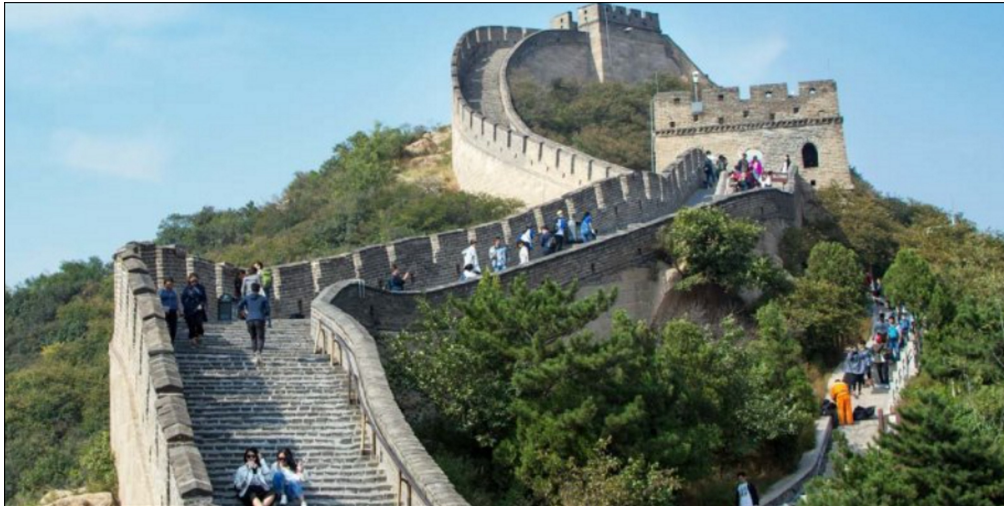
نماذج من حضارات آسيا القديمة: سور الصين العظيم

قامت في قارة آسيا حضارات متطورة في فترة التاريخ القديم كحضارات الصين والهند وبلاد الرافدين، وهي حضارات متقدمة في الزراعة والعمارة والفنون والتنظيم العسكري.