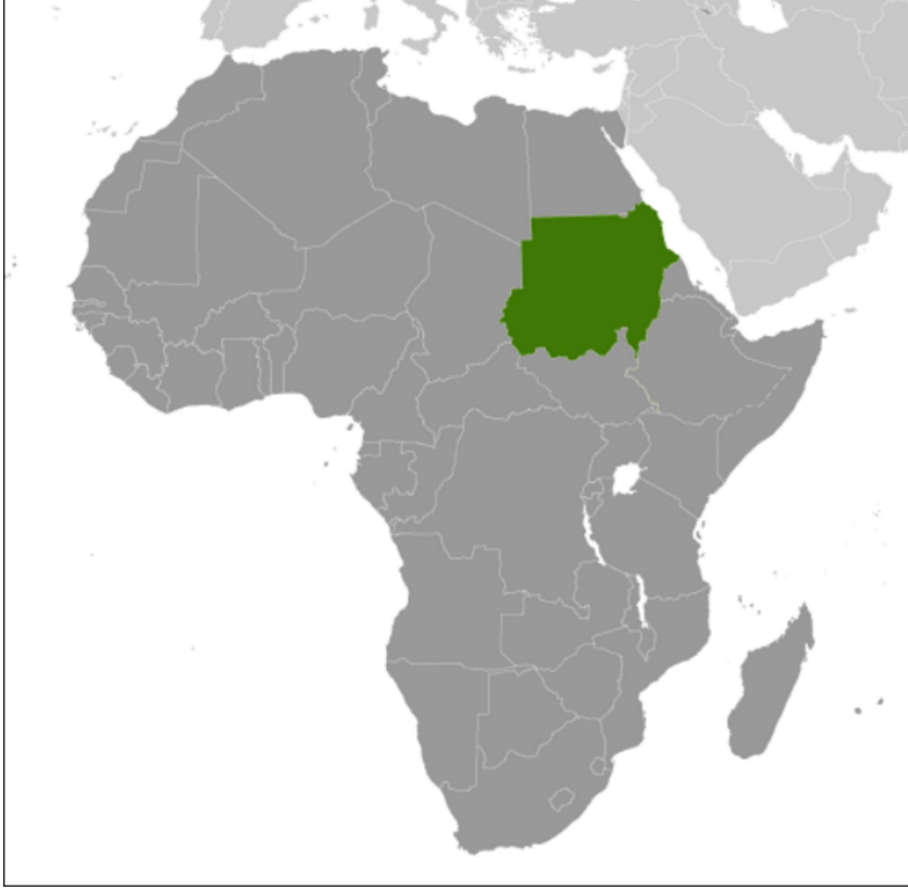
خريطة إفريقيا وداخلها دولة السودان

نحن سودانيون. أنتَ وأنتِ وأنا سودانيون ووطننا السودان. السودان دولة تقع في قارة إفريقيا. السودان دولتنا، وإفريقيا قارتنا.