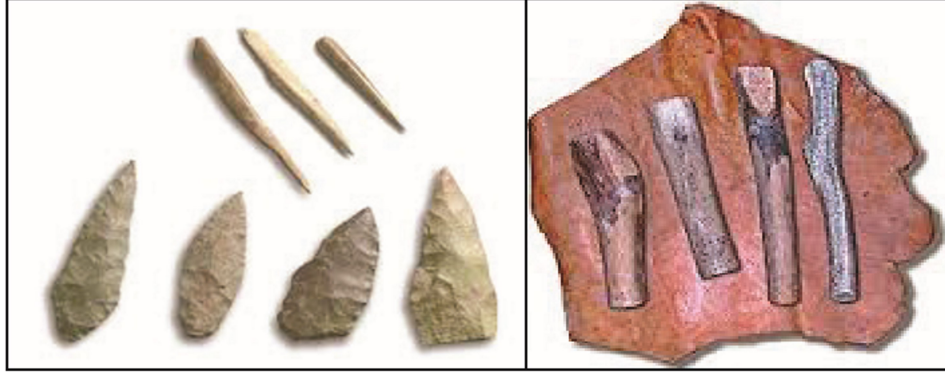
نماذج أدوات من العصور الحجرية

سكن البشر في إفريقيا منذ أقدم العصور، وأقاموا فيها حضارات متطورة. وقد عرف الأفارقة كثيراً من الأشياء كصناعة الأدوات والصيد والزراعة ونظم الحكم والآداب والفنون، وقد تركز الإفريقيون على صنفاً أنهارهم كالنيل وأقاموا فيها مدنهم وحضاراتهم منذ فترة العصور الحجرية.