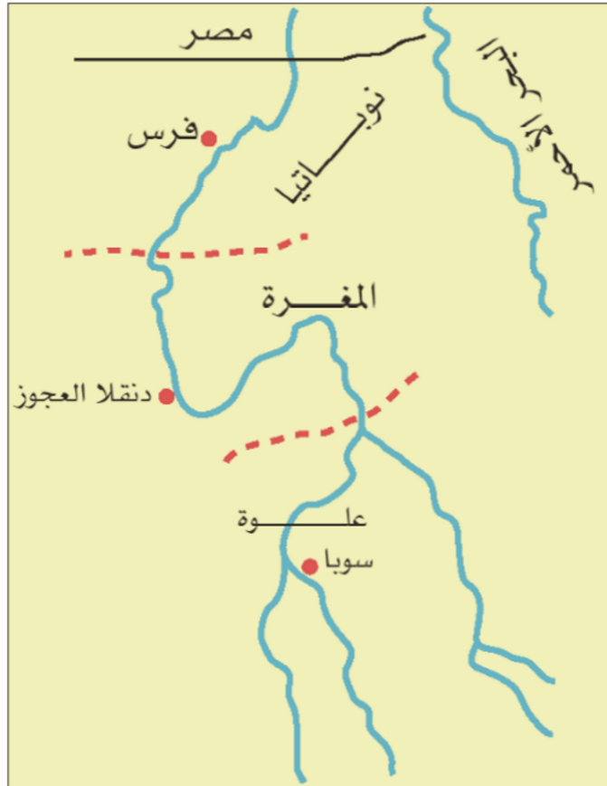
ممالك النوبة المسيحية في السودان

ذكرنا أنه قد قامت في إفريقيا حضارات متطورة في فترة التاريخ القديم، تفوقت على كثير من حضارات العالم القديم. بعد ذلك جاءت مؤثرات من خارج القارة، أثرت على تطور حضارتها، أهمها: المسيحية والإسلام. والمسيحية هي الديانة التي جاء بها نبي الله عيسى عليه السلام، وانتشرت في العالم القديم، ووصلت إلى إفريقيا في القرن الأول لميلاد المسيح، وتأثرت الحضارات الإفريقية بالمسيحية، وقامت دول وممالك مسيحية في أجزاء متعددة من القارة مثل الممالك المسيحية التي قامت في السودان في ذلك الوقت وهي: نوباتيا وعاصمتها فرس، المقررة وعاصمتها دنقلا العجوز، علوة وعاصمتها سوبا.